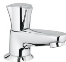
Foto : Toiletkraan Grohe Costa L Chroom