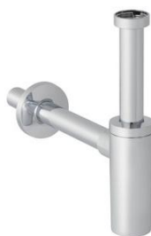
Foto : Bekersifon voor wastafel toilet gelijkvloers in chroom