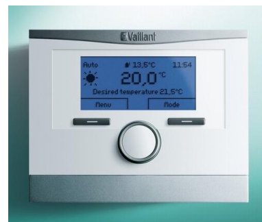
Foto : Weersafhankelijke kamerthermostaat type multiMATIC VRC 700 van Vaillant

(*) De voorbeelden zijn informatief. Ten gevolge van stopzettingen in productie, leveringsproblemen, nieuwe series of een andere leverancier is het steeds mogelijk dat andere toestellen, dan de hierboven vermelde, met minstens evenwaardige kwaliteit als basis worden aangeboden