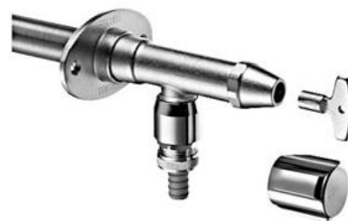
Foto : Vorstvrije buitendienstkraan