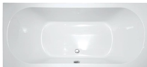
Foto : Acryl ligbad wit met afmetingen 170x75cm