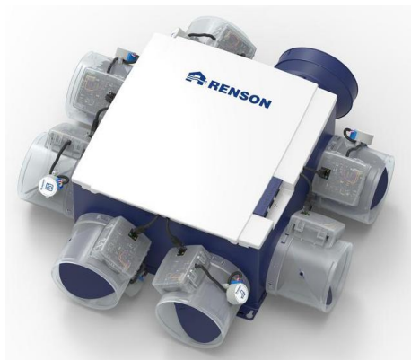
Foto : Ventilatiebox type Renson Healthbox II