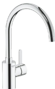
Foto : Ééngreeps keukenmengkraan van Grohe