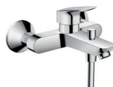
Foto : Ééngreeps bad- & douchemengkraan type Logis van Hansgrohe