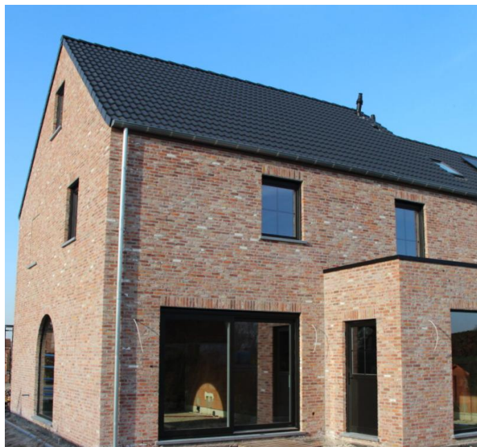
Foto : Gevelsteen type Beerse Klinker Rijnformaat Gemetsel In wildverband

De opbouw van de spouwmuur ziet er als volgt uit (van binnen naar buiten) :