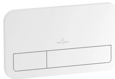
Foto : Witte bedieningsplaat van Villeroy & Boch Voor hangtoilet gelijkvloers