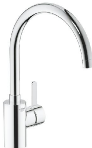
Foto : Ééngreeps keukenmengkraan van Grohe