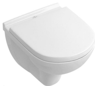
Foto : Hangtoilet van Villeroy & Boch met softclose zitting (gelijkvloers)

(* ) Wegens de snel evoluerende markt aan nieuwe series van sanitaire toestellen en/of in geval moeilijkheden qua leveringen is het mogelijk dat andere sanitaire toestellen, dan deze hierboven & hierna vermeld, in basis worden aangeboden. Echter zullen in dit geval de aangeboden toestellen steeds minstens evenwaardig zijn & minstens dezelfde handelswaarde hebben.