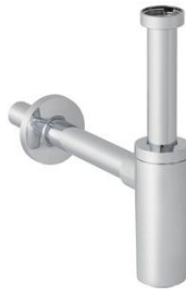
Foto : Bekersifon voor wastafel toilet gelijkvloers in chroom