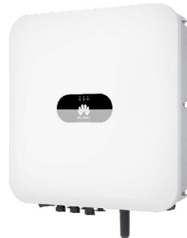
Foto : Omvormer type Sun 2000 van Huawei