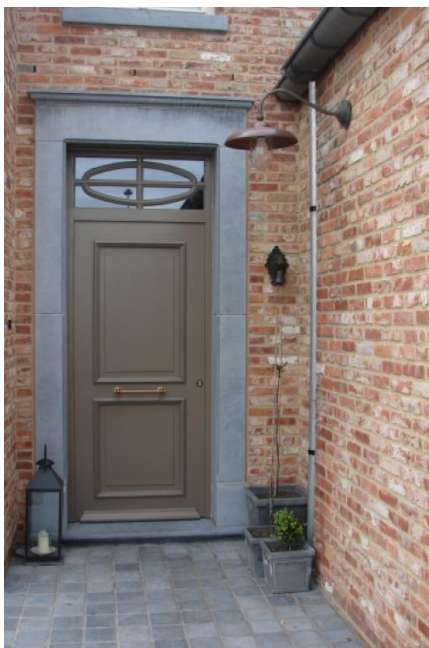
Foto : Gevelsteen type Beerse Klinker Waalformaat gemetsel in Wildverband

Alle binnenmuren worden traditoneel ter plaatse gemetsel en/of verlijmd. De aanzet van de binnenmuren gebeurt door middel van een isolerende steen type Kimblok van Xella of evenwaardig. Het parament wordt uitgevoerd in een oude récupératie-gevelsteen type Beerse Klinker (Rijnformaat) gemetsel in wildverband;