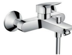
Foto : Ééngreeps bad- & douchemengkraan type Logis van Hansgrohe