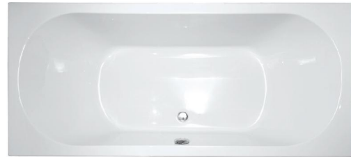
Foto : Acryl ligbad wit met afmetingen 170x75cm