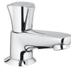
Foto : Toiletkraan Grohe Costa L Chroom