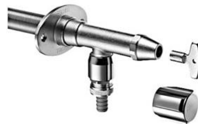
Foto : Vorstvrije buitendienstkraan