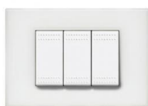
Schakelmateriaal van Bticino type Light (kleur: Wit)

De stopcontacten en schakelaars zijn van het merk Bticino van het type Light (kleur wit – inbouw muur).