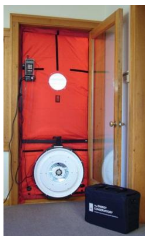
Foto : Uitvoeren van een blowerdoortest

Bij een blowerdoortest wordt de luchtdichtheid van de woning vastgesteld door haar bloot te stellen aan een over- & onderdruk van 70 Pa. Het volume lucht dat hierbij ontsnapt aan of infiltreert in de woning t.o.v. de bouwschillen palend aan de buitenomgeving is een maat voor de luchtdichtheid van de woning. Hoe beter de luchtdichtheid van de woning hoe minder warmteverlies men heeft en hoe meer gecontroleerd de ventilatie kan gebeuren. Tijdens het oprichten van de woning wordt er door ons extra aandacht besteed aan de uitvoeringsmethoden om een zo'n hoog mogelijke luchtdichtheid te behalen. Na het uitvoeren van de blowerdoortest wordt er aan de hand van een rapport meegegeven welke zones bij definitieve afwerking (schilderfase) alsnog extra kunnen aangepakt worden om een nog hogere luchtdichtheid te verkrijgen.