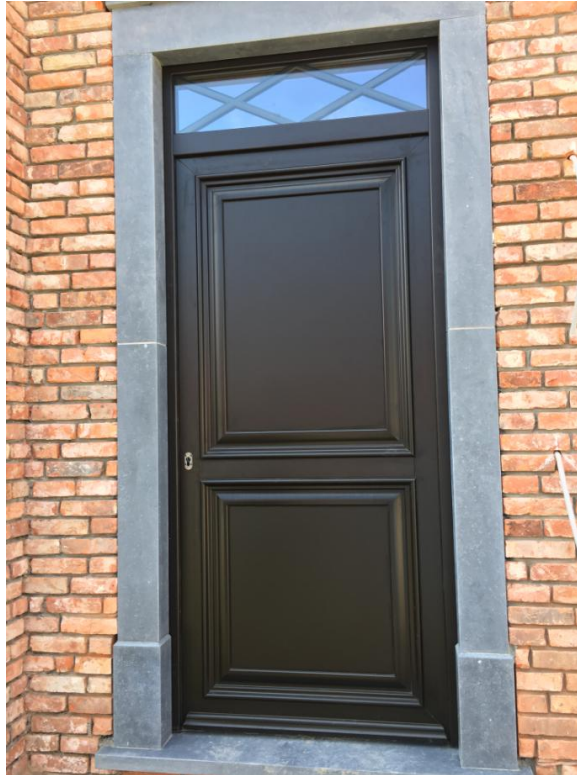
Foto : standaard type voordeur – bovenlicht voorzien van 2 verticale kleinhouten ipv 2 diagonalen zoals op bovenstaande foto

Het raam-/deurprofiel heeft minstens een 5 – kamersysteem en is voorzien van de nodige dichtingen voor een degelijke wind- en waterdichtheid.