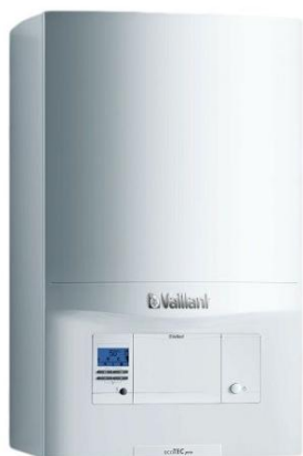
Foto : Gaswandcondensatieketel type Ecotec Pro Type VCW 286 van Vaillant

De ketel is een condensatiegaswandketel van het merk Vaillant type Ecotec Pro VCW 286. De temperatuurregeling gebeurt via een weersafhankelijke digitale kamerthermostaten met dag of weekprogrammatie, type calorMATIC VRC 700 van Vaillant.