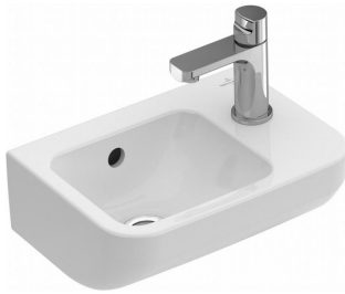
Foto : Hangtoilet van Villeroy & Boch met softclose zitting (gelijkvloers)