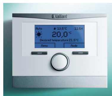
Foto : Weersafhankelijke kamerthermostaat type multiMATIC VRC 700 van Vaillant

(* De voorbeelden zijn informatief. Ten gevolge van stopzettingen in productie, leveringsproblemen, nieuwe series of een andere leverancier is het steeds mogelijk dat andere toestellen, dan de hierboven vermelde, met minstens evenwaardige kwaliteit als basis worden aangeboden