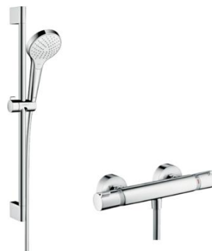
Foto : Douchegarnituur van Hansgrohe (compleet) type Croma Select S Vario Combi 65cm chroom