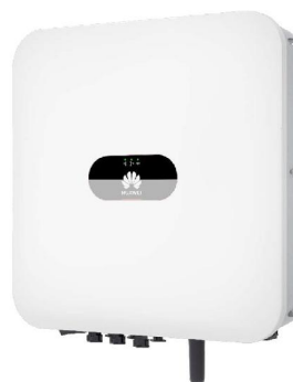
Foto : Omvormer type Sun 2000 van Huawei