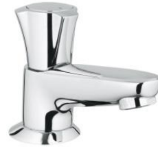
Foto : Witte bedieningsplaat van Villeroy & Boch Voor hangtoilet gelijkvloers