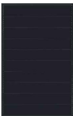
Foto : Full Black fotovoltaïsch monokristallijn zonnepaneel 20 jaar productgarantie Lineaire vermogensgarantie Merk Stern of evenwaardig

De zonnepanelen worden gemonteerd op een aluminium frame onder helling voor een woning met een platdakopbouw.