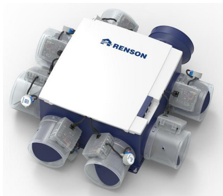
Foto : Ventilatiebox type Renson Healthbox II