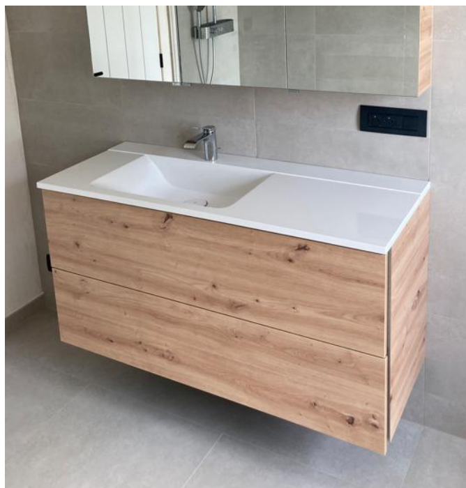
Foto : Voorziene badkamermeubel met afmetingen 120x50cm Standaard beschikbaar in diverse kleuren Dubbele waskom mogelijk mits prijsverrekening. Idem voor bijhorende kolomkast