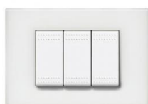
Schakelmateriaal van Bticino type Light (kleur: Wit)

De stopcontacten en schakelaars zijn van het merk Bticino van het type Light (kleur wit – inbouw muur).