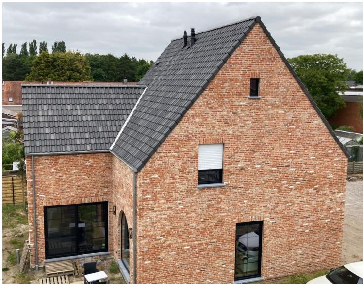
Foto : Dakbedekking bestaande uit de Brugse dakpan van Monier kleur blauwgrijs

De dragers van de dakpannen, met name de panlatten, zijn behandeld (gedrenkt) tegen aantasting van insecten, zwammen, houtrot... De definitieve dakbedekking bestaat uit een Brugse dakpan van Monier (kleur : blauwgrijs). Deze betonnen dakpan is een klassieke & elegante dakpan welke een landelijke & rustieke stijl uitstraalt.